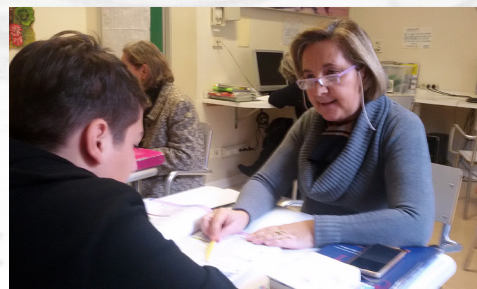
Scuola Secondaria di II grado (lezione di francese)