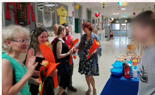
Esame di Stato al termine del I ciclo